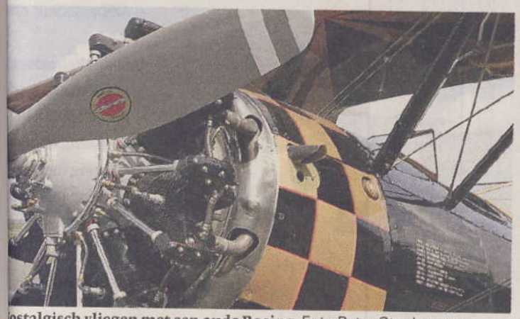
nostalgisch vliegen met een oude Boeing.